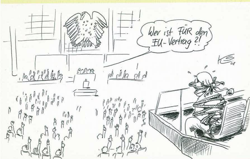
M1 „Abstimmung EU-Vertrag“ Karikatur von Klaus Stuttmann, 2008

Nutzen Sie das Wahlmodul „Europa – Integrationskräfte Deutschland und Frankreich“ als Nachschlagewerk und erläutern Sie die Aussage der Karikatur. Versetzen Sie sich hierbei in die Person im rechten Bildteil. Was könnte Sie über das dargestellte Vorgehen denken? Verfassen Sie hierzu eine Denkblase.